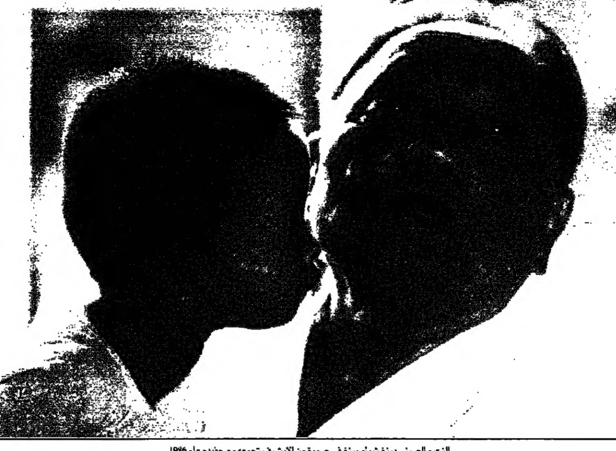
الزعيم الصيني دينغ شياو بينغ في صورة من الأرشيف تتجمع مع حبيبه عام 1986